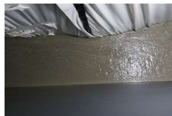
模擬トンネルで覆工コンクリートを自動打設中