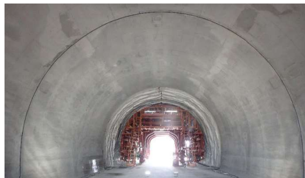
脱型後の仕上がり状況

2020年2月～3月に「模擬トンネル」で2回の打設試験を行い、本システムの有効性と表面の仕上がり状況を確認しました。制御システムに入力した計画通りに完全自動で打設が進み、システムの有効性は確認できました。現在、表面の仕上がりや入力パラメータの因果関係の詳細分析を実施中であり、その結果を踏まえて、美観も含めた自動打設方法の最適化を図ります。